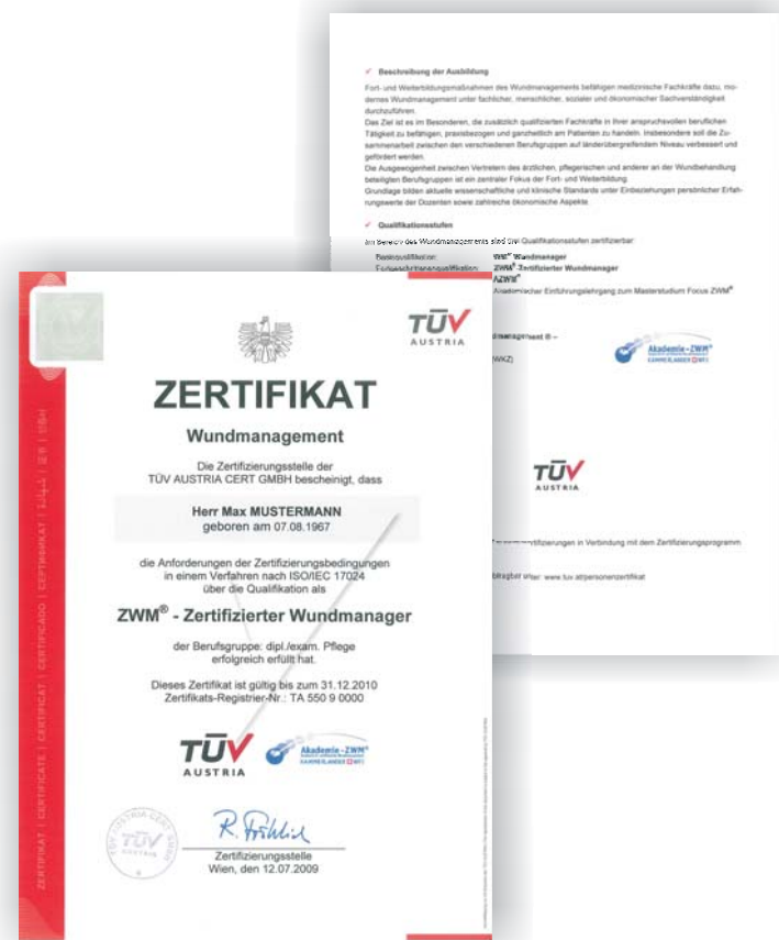
Beispielzertifikat der Fortgeschrittenenqualifikation eines exam./dipl. Pflegers

Der Name und die Qualifikationsstufe aller zertifizierten Personen werden während der Gültigkeitsdauer der Zertifizierungsnachweise zusätzlich auf den Websites des TÜV AUSTRIA und der Akademie-ZWM veröffentlicht.